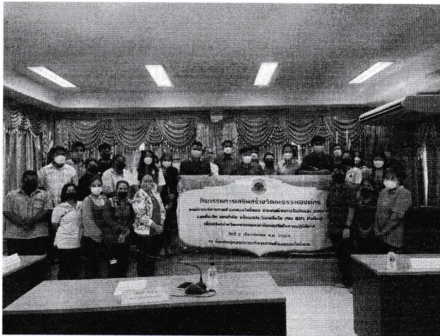
พนักงานส่วนตำบลทุกท่านทุกระดับร่วมกิจกรรมต่อต้านงดให้ งดรับ ไม่ถามถึงการให้ การรับ ของขวัญ ของที่ระลึก ของกำนัล หรือประโยชน์อื่นใดทุกชนิดและร่วมกิจกรรม ณ. วันที่ ๒ มีนาคม ๒๕๖๕